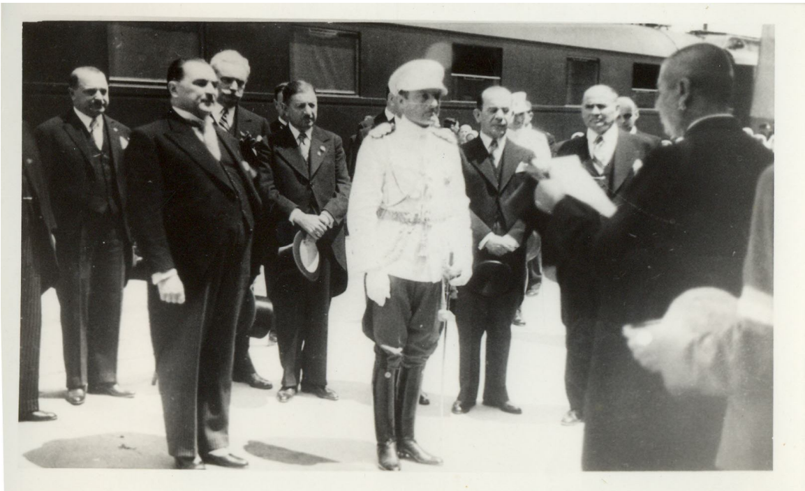
Кнез намесник Павле Карађорђевић на перону железничке станице у Нишу

У 10 часова завршено је богослужење у Саборној цркви, а истовремено и свечаност Аероклуба. После богослужења, учињен је помен палим борцима од Косова до Првог светског рата. После парастоса скопски митрополит је одржао беседу и нагласио сву славу победе и цену слободе коју је дао српски народ за слободу.